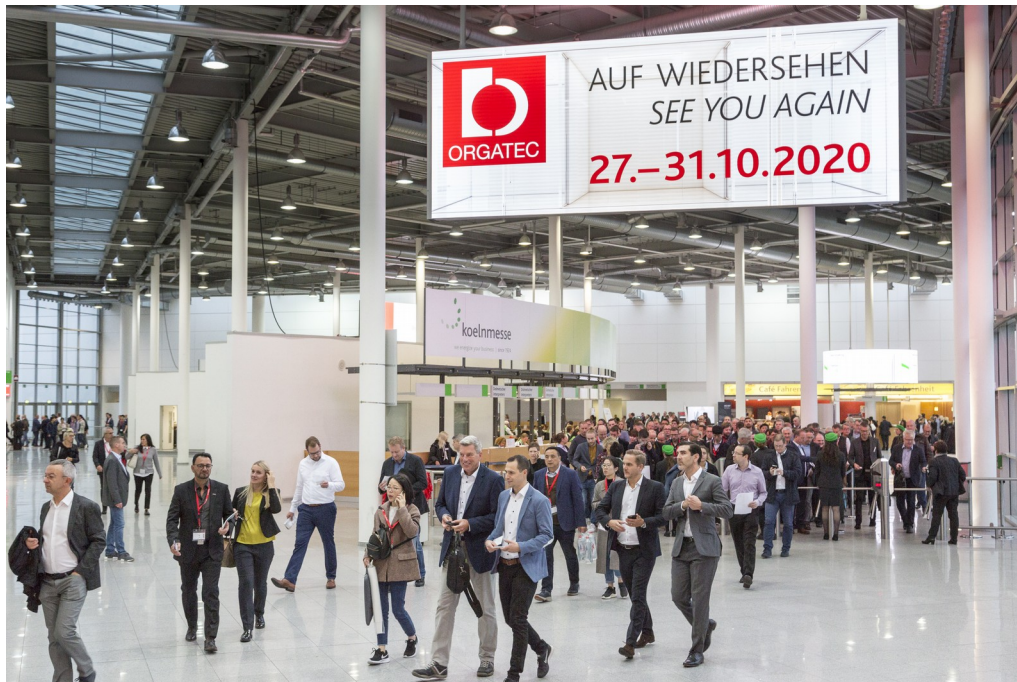
ORGATEC setzt auf FairMate, auch beim Leadtracking für die Aussteller

Aussteller können den Besucherdaten zusätzliche, individuelle Informationen wie Gesprächsnotizen hinzufügen oder mit Hilfe von „Tags“ in selbst definierten Kategorien zusammenfassen. Durch die FairMate LeadTracking App entfällt die manuelle, fehlerbehaftete Nacherfassung der gesammelten Kontaktdaten. Die Daten des Besuchers stehen sofort digital für weitere Vertriebs- und Marketingaktionen zur Verfügung – jetzt erstmals, indem die FairMate Leadtracking App in Echtzeit die Daten der eingessanten Kontakte an die Schnittstelle sendet, wo die Aussteller sie in ihr CRM-Softwarelösung wie zum Beispiel Salesforce einbinden können. Dort können die Aussteller sofort die Daten nutzen.